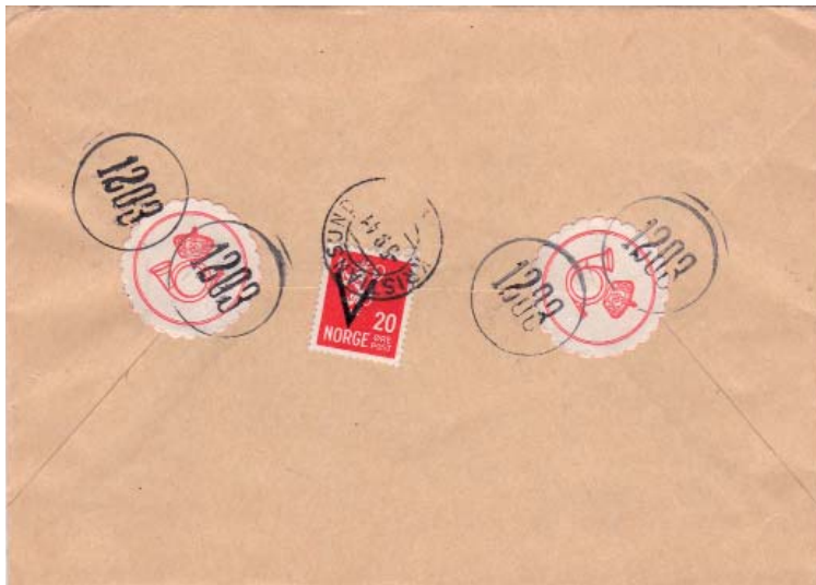
Et eksempel på et verdibrev forseglet med postoblater og postoblatstempler. Dette er sendt fra Kristiansund i 1941.

1431 i sort og rødt. 5260 i fiolett. 2288 i grønt. 3835 i grønt og rødt. Hva vi snakker om? Postens oblatstempler som ble tatt i bruk fra 1. august 1941, og som var i bruk helt frem til 1. januar 1947. Og grunnen til det hele: At lakk til forsegling av verdibrev ble en av tusenvis av mangelvarene man opplevde under krigen. Verdibrev skulle jo etter bestemmelsene forsegles med lakk, men når lakk ikke lenger var å oppdrive, måtte nye løsninger finnes. Og det ble altså egne postoblater i papir, og egne gummistempler med nummer som etter hvert ble tildelt postkontorer, underpostkontorer, postekspedisjoner, og noe senere alle landets poståpnerier. Det ble mange etter hvert. Det startet med nummer 1, og endte til slutt opp på det til i dag høyest kjente nummer – 6249, som ble tildelt postkontoret Majorstua i Oslo.