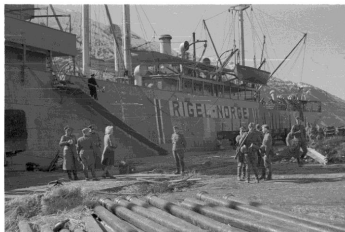
MS Rigel ved kai i Mosjøen

«Rigel» gikk under norsk flagg, med norsk besetning til høsten 1944 da det fikk tysk besetning på 29 personer.