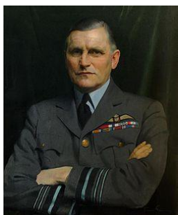
Air chief marshal Sholto Douglas, sjef for RAF Coastal Command

Høsten 1944 hadde den britiske øverstkommanderende for Coastal Command, Sholto Douglas utstedt en hemmelig ordre som ga tillatelse til å angripe alle tyske skip over 1500 tonn nord for Stavanger. Motivet var trolig å hindre tysk styrkeforflytning sørover langs kysten til kampene som pågikk for fullt på kontinentet. På den tiden var det 300 000 tyske soldater i Norge. Den norske eksilregjeringen ved forsvarrets overkommando kjente til den britiske strategien. De britiske flyverne som senket «Rigel» trodde antakelig at de senket et skip med tyske soldater. Flyene skulle i utgangspunktet angripe havnen og jernbanestasjonen i Mosjøen.