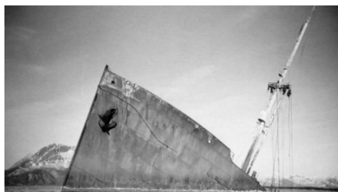
Forenden til Rigel ble stående på grunn

Skipet ble liggende synlig opp av sjøen ved Rosøya til rundt i 1969. Da ble baugen kuttet seks meter under overflaten, og levningene av de omkomne som lå i skipet ble begravd uten å bli identifisert. Det var ikke tillatt å fotografere mens vraket ble ryddet for levninger. Tidligere hadde sportsdykkere tatt med seg hodeskaller og andre levninger som suvernier. De omkomne ligger på krigskirkegården på Tjøtta. På øya hvor Rigel ble kjørt på land er det satt opp et minnesmerke som er synlig fra leia, i form av to propeller fra Rigel.