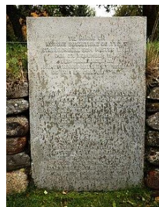
Minnetavle på den internasjonale gravplassen på Tjøtta

Skipet ble liggende synlig opp av sjøen ved Rosøya til rundt i 1969. Da ble baugen kuttet seks meter under overflaten, og levningene av de omkomne som lå i skipet ble begravd uten å bli identifisert.