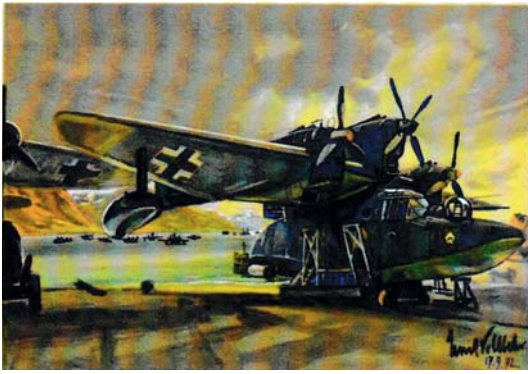
Et av okkupantenes postkort fra Norge 1940-1945.