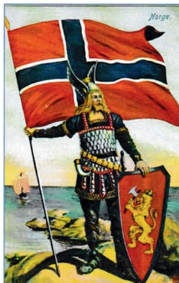
Et herlig patriotisk kort fra 1905.