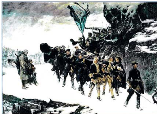
Et kort som foreviger en begivenhet under den store nordiske krig 1700-1721: Kong Karl XIIIs legeme bæres over grensen fra Norge etter at han ble skutt og drept ved Fredriksten festning 11. desember 1718.