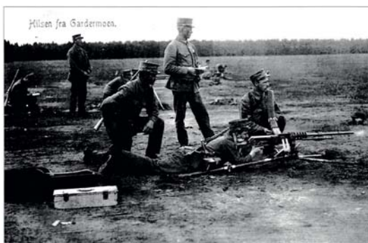
Hilsen fra-kortene vi kjenner så godt har selvfølgelig også militære motiver, som dette fra Gardermoen i mellomkrigstiden.

Det er som sagt vikingtiden det starter med. Riktignok sendte ikke vikingene altfor mange kolorerte